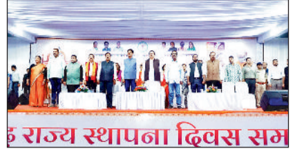
6 राज्य स्थापना दिवस सम