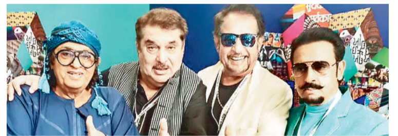
परफॉर्मिंग का दर्शन

नई दिल्ली। हिंदी सिनेमा में खलनायकों का भी एक दौर था, जिनको झलक से भी दर्शकों की खांसे धम जाती थीं। इन्हीं में रंजीत, रजा मुराद, किरण कुमार और गुलशन गोवर भी शामिल थे। भले ही ये अब सिल्वर स्क्रीन पर कम नजर आते हैं, लेकिन एक समय था, जब सिल्वर स्क्रीन पर इनका खूब बोल-बाला था। फिल्मों में इन खलनायकों का हीरो से भी ज्यादा दबदबा था। इसी बीच दर्शकों को पुराने दौर के विलेन की याद दिलाने के लिए अभिनेता रजा मुराद ने सोशल मीडिया पर कई तस्वीरें पोस्ट कीं। एक्टर ने इंस्टाग्राम पर जो तस्वीरें पोस्ट कीं, उसमें रजा मुराद के साथ किरण कुमार और गुलशन गोवर भी नजर आ रहे हैं। अभिनेता ने पोस्ट कर जमाकिया अंदाज में कैप्शन लिखा, 'भारत के चार सबसे शरीफ, सौधे-सादे मासूम गोले-भाले महापुरुष।'